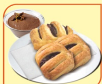
Кроасан мини с шоколадов мус