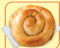
Вита баничка с тиква