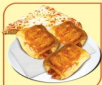
Кроасан мини с пица