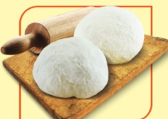
Тесто за пица и мекици топка

Професионални теста Лакис: бутер, кроасаново, блундер и тесто за пица и мекици.