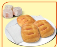
Кроасан мини с локумена паста