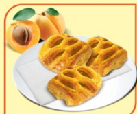
Кроасан мини с кайсия