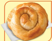
Вита баничка със сирене

Разработени по изискванията на Наредба №9 , и на Наредба №6 за специфичните изисквания за безопасността и качеството на храните, предлагани в детските заведения и училища.