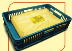
Тесто кроасаново производствено