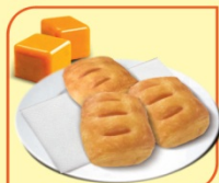
Кроасан мини с карамел