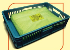
Тесто блундер производствено