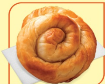
Вита баничка с ябълка