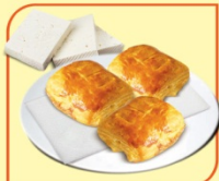
Кроасан мини със сирене