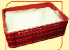
Тесто бутер производствено