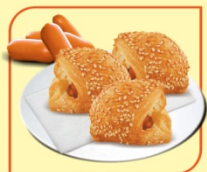
Хапки с кренвирш

Кулинарна препоръка: за получаване на повече блясък, намажете повърхността с добре разбит жълтък.