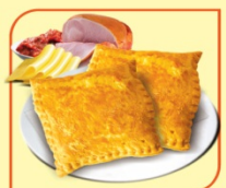
Баница с шунка кашкавал и лютеница