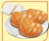
Хапки със сирене

Закуски от бутер тесто със солени пълнежи и превъзходен вкус. Подходящи за заведения, хотели, бърза закуска, топли витрини.