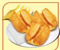
Хапки с кашкавал