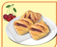
Кроасан мини с вишна