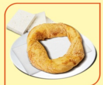
Геврек със сирене и сусам